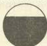
Phosphate acide de chaux