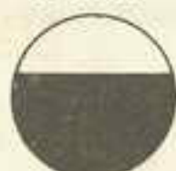
Glycérophosphate de chaux