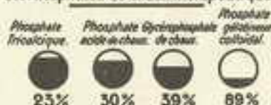
TABLEAU COMPARATIF DU DEGRÉ D'ASSIMILATION des Phosphates de Chaux Thérapeutique

ADULTES : 2 à 3 cuillerées à bouche par jour avant les repas. ENFANTS : 2 à 3 cuillerées à dessert ou à café selon l'âge.