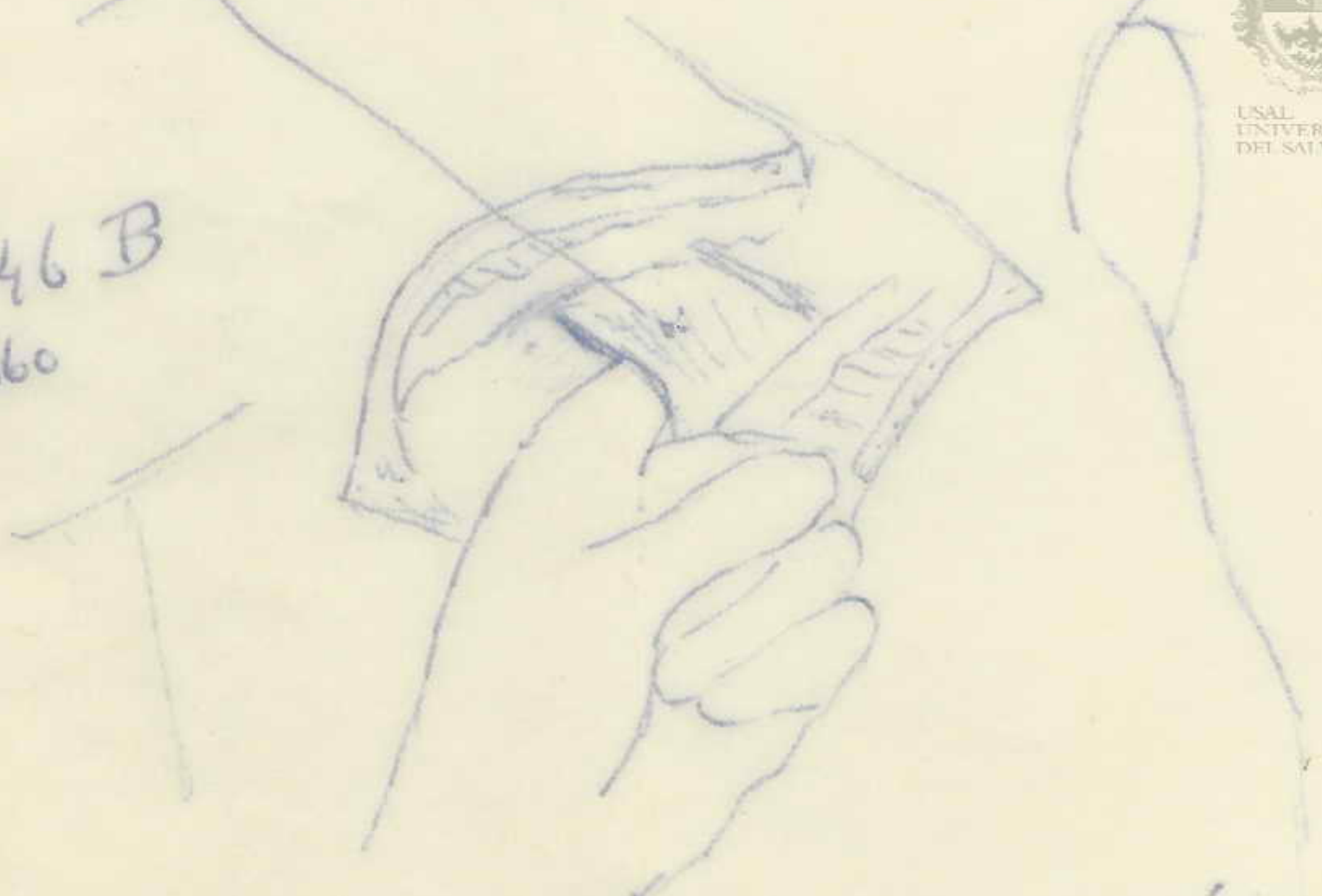
Figura demarcativa simplificada.